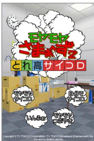
モヤっとしたら思い出して下さい