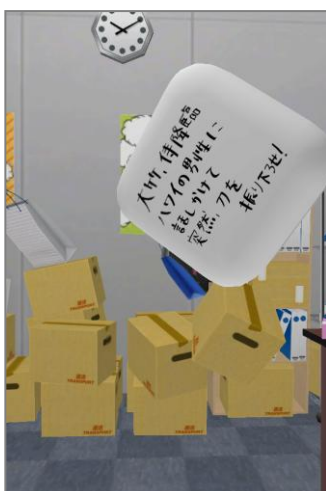
振ってサイコロを投げろ！